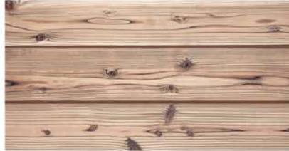
GSYV 160-39 N