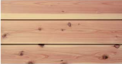
GSY 160-39 N