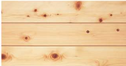
WHT 108-29 UP