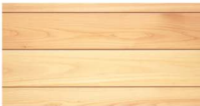
WHC 90-39 UP