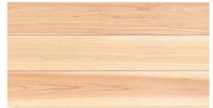
FHM 108-39E N