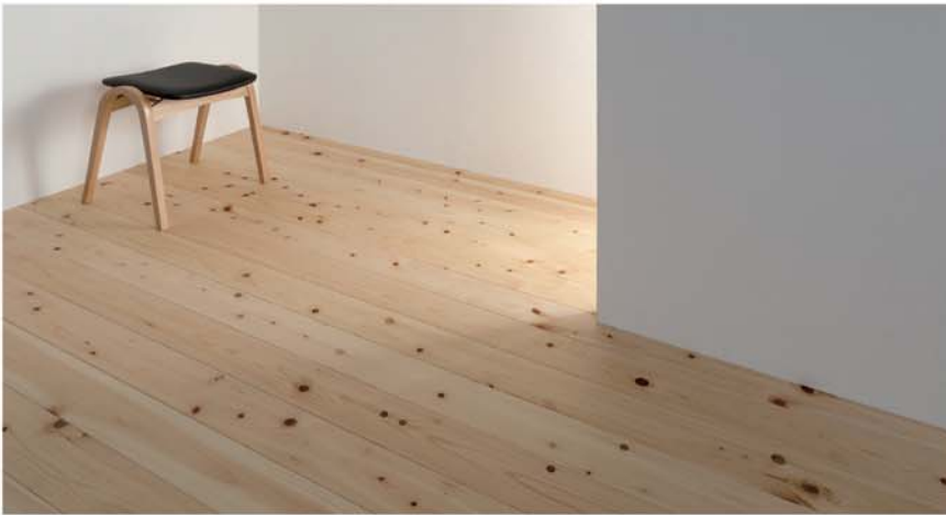
FHT 108-39E OP

桧は、古来より日本の最高級の建築材として使われている高級材です。独特の香りと美しい光沢を持ち、時がたつにつれて美しいあめ色に変わってきます。狂いが少なく、腐りにくく、耐久性にも優れている為、柱をはじめ土台、造作、建具などに幅広く用いられ、現在ではフローリング、羽目板にも人気があります。