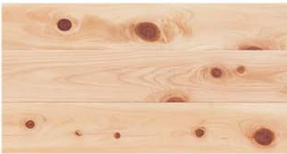
FHT 108-39E N