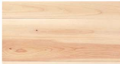
FHJ 108-39E N